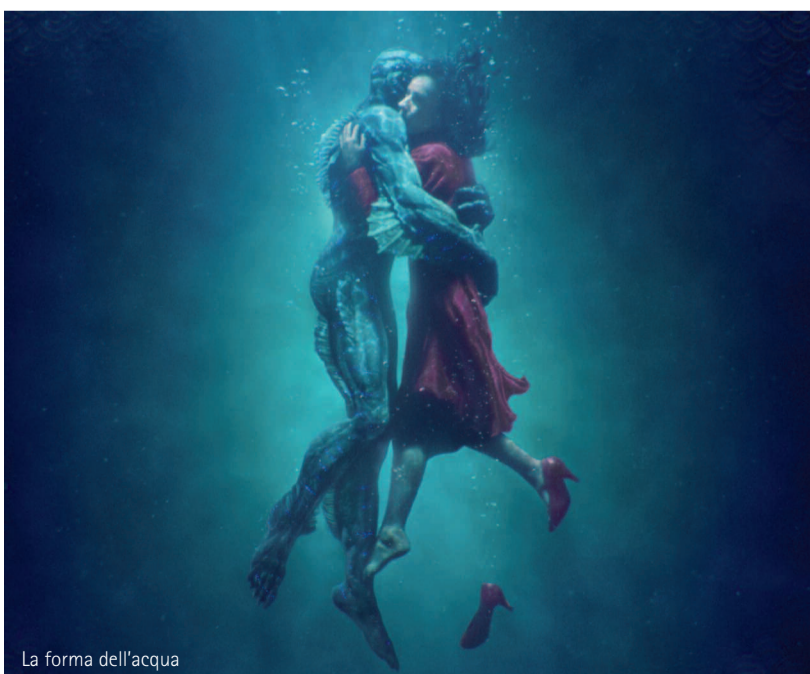
La forma dell'acqua

America sullo sfondo della Guerra Fredda. Elisa, affetta da mutismo, lavora in un segretissimo laboratorio governativo. Intrappolata in una vita di silenzio, la sua esistenza cambia per sempre quando scopre un esperimento segreto: una creatura squamosa dall'aspetto umanoide. The US against the background of the Cold War. Elisa - who suffers from mutism - works in a super secret government lab. Trapped in a life of silence, her existence changes for good when she discovers a secret experiment: a scaly humanoid-looking creature. MULTISALA ROSSINI, SALA 3 Martedì 31 luglio e mercoledì 1 agosto, ore 19.10/21.30,