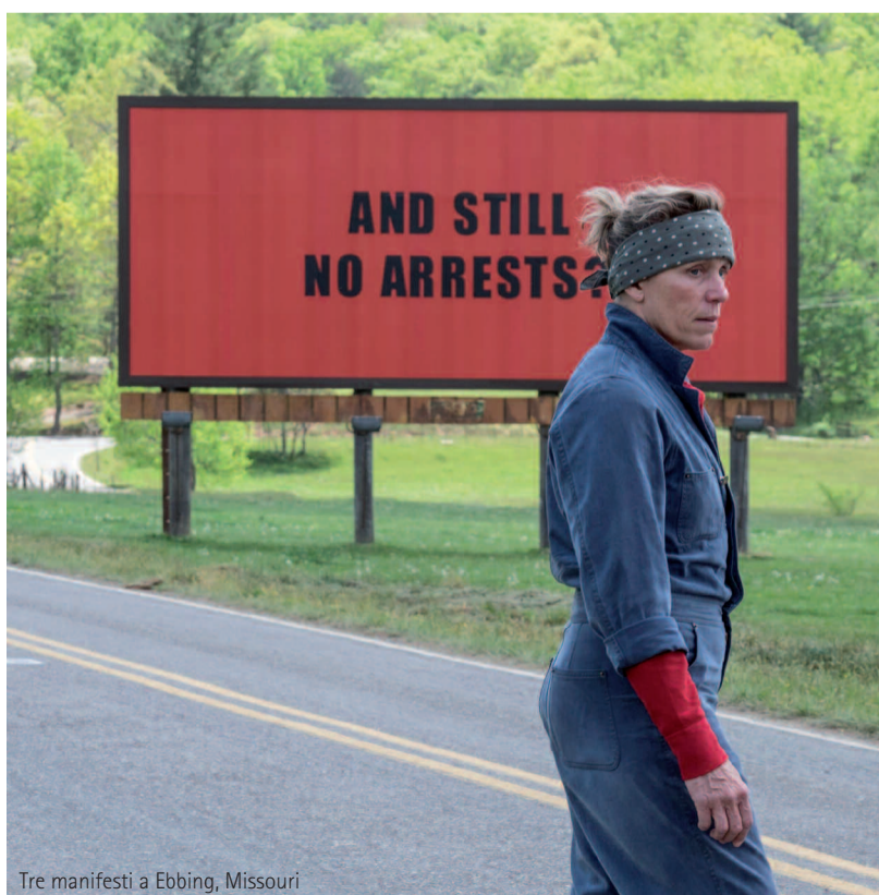
Tre manifesti a Ebbing, Missouri