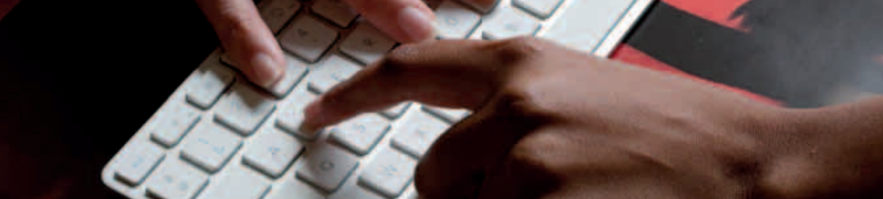
Fotografia di Paolo Della Corte, Tale of Tales, Le mani (particolare)