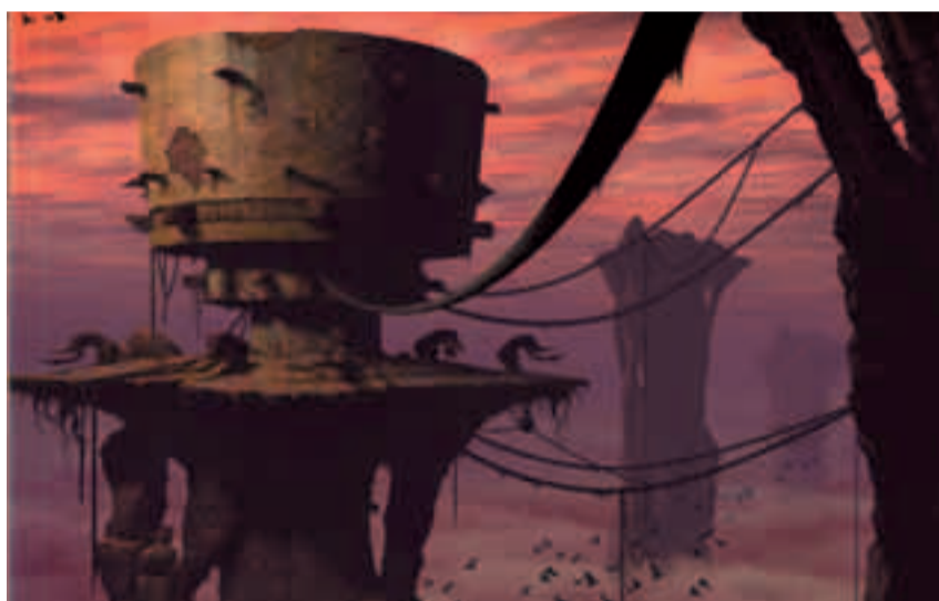
Opera di Lorne Lanning, Oddworld