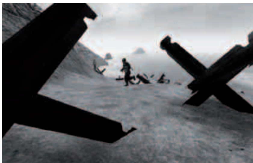
Marco Cadioli, ARENAE (D-Day, Omaha Beach) , 2005, Digital print.