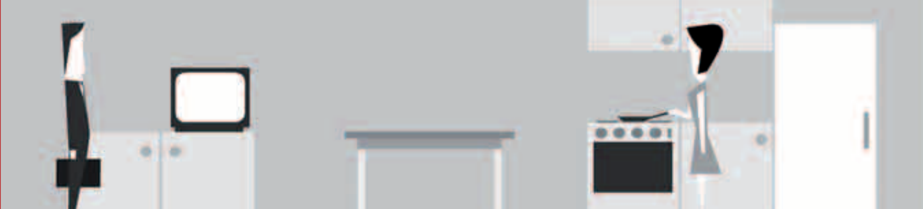
Molleindustria, Every day the same dream , 2009, Videogame, screenshot (particolare).