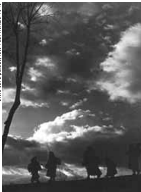
Cielo sulla palude, foto Paul Ronald 1949