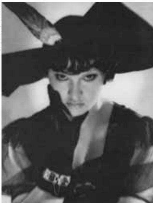
Ginette Leclerc 1937