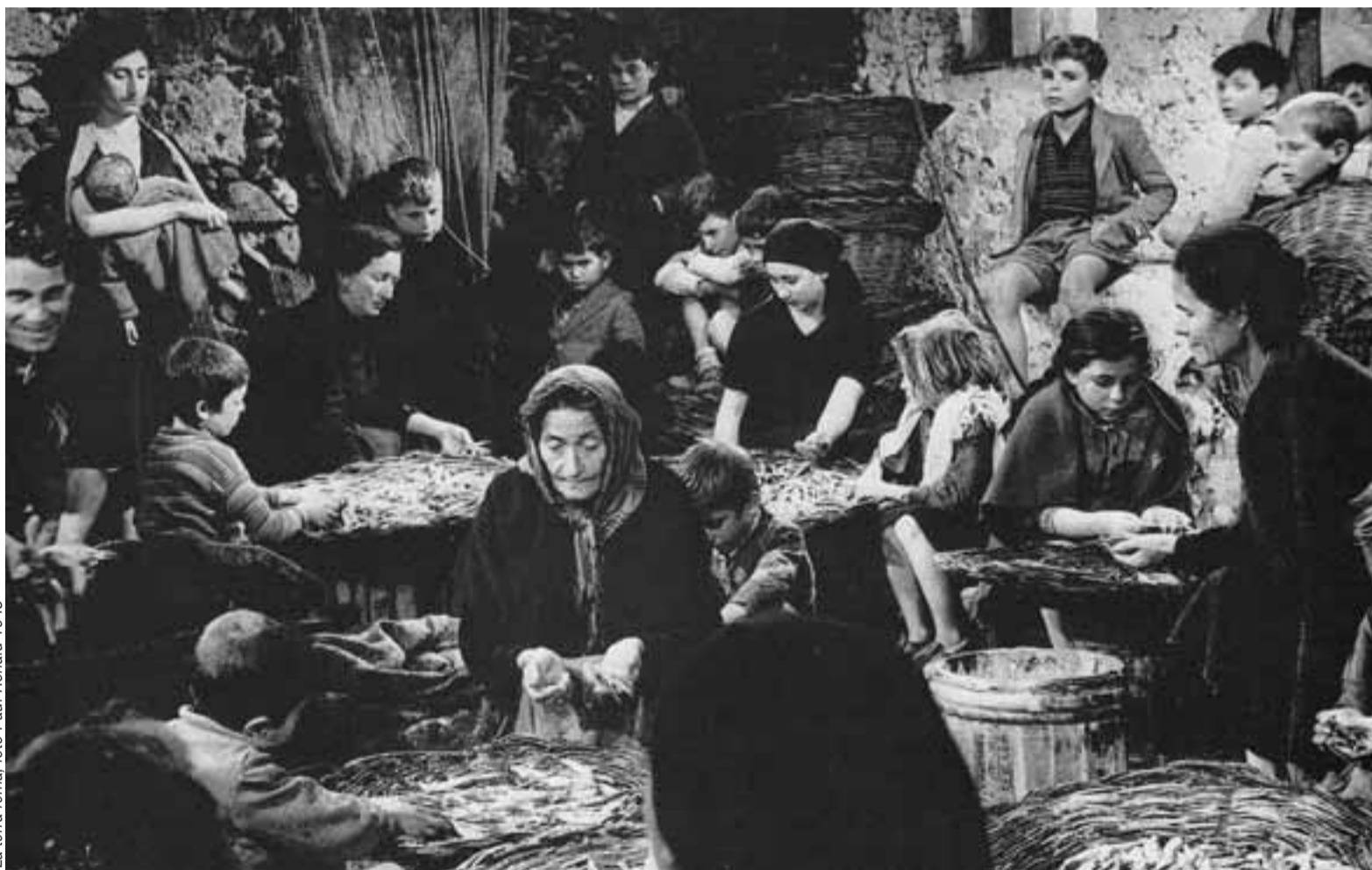
La terra trema 1948