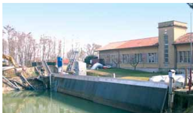
2b - Il bacino dell'idrovora di Campalto dopo l'intervento di pulizia