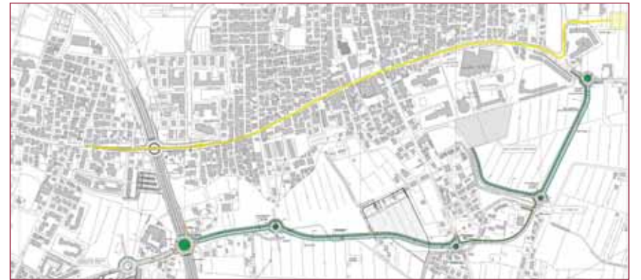
planimetria della Vallenari bis, tratto 1 che va da via Triestina e via Casona.

La strada che offrirà al traffico una valida alternativa all'inflazionata via Triestina sarà a due corsie, una per ogni senso di marcia, è lunga 2.218,50 metri. Costerà 11.000.000 di Euro. Dal momento di aggiudicazione della gara i tempi di realizzazione saranno di due anni.