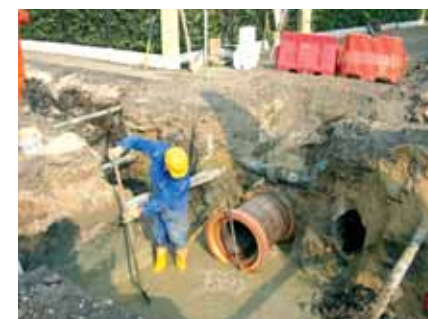
5a - Lavori per la posa delle fognature nuove nelle vie Cereda, Gosaldo e Mauria