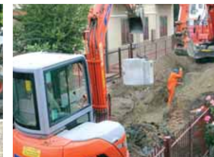
5c - Scavi per la posa delle fognature nuove, vie Cereda Gosaldo e Mauria