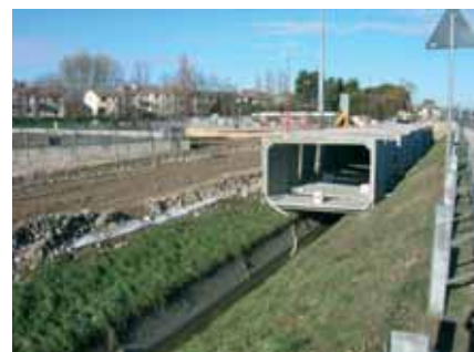
3b - La sistemazione degli abbinati, lato sud ovest (verso Carpenedo)