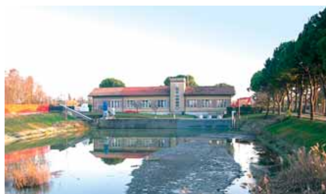
2a - Il bacino dell'idrovora di Campalto prima della pulizia