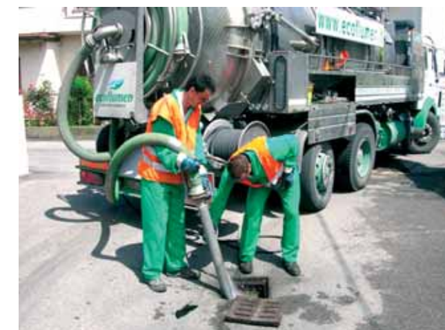
4b - Pulizia dei tombini lungo via Passo Cereda