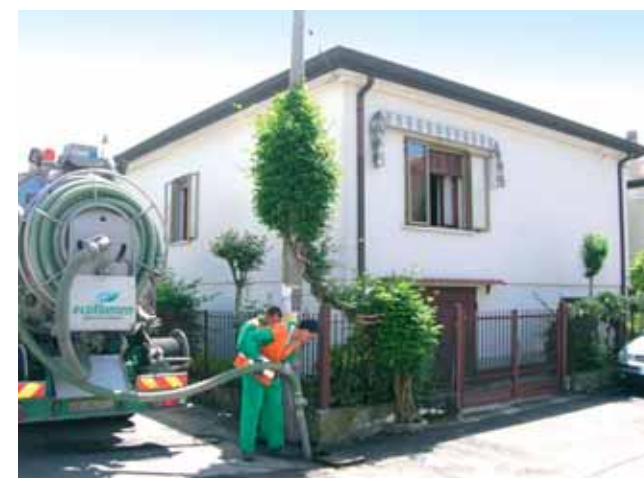
4a - Un intervento semplice ma essenziale, la pulizia dei tombini in via Passo Cereda