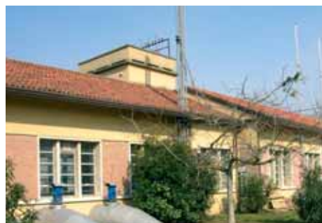
1b - L'edificio dell'impianto Idrovora di Campalto