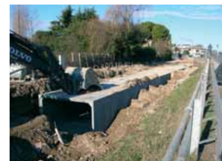
3c - Un altro momento della sistemazione degli abbinati, sempre lato sud ovest