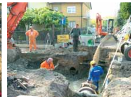
5b - I lavori per le fognature nuove nelle vie Cereda, Gosaldo e Mauria hanno causato qualche disagio, ma porteranno enormi benefici a tutta la zona allagata nel 2007