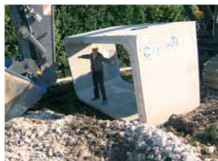
3a - La dimensione dei tubi posti sugli Abbinati all'incrocio di Favaro