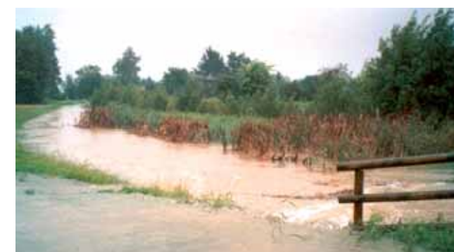
6b - La situazione della Fossa Pagana il 17 settembre 2006