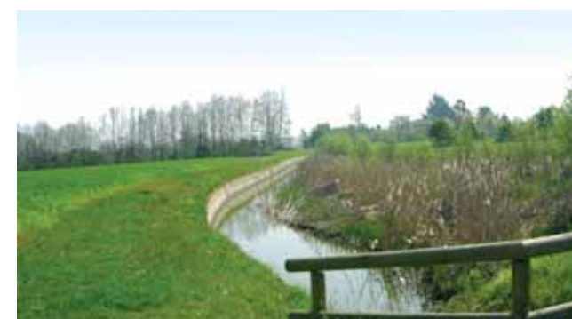
6a - La Fossa Pagana nell'aprile 2007, in una situazione di deflusso normale