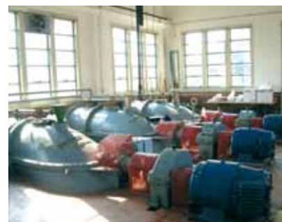
1c - Impianto idrovora di Campalto, le pompe