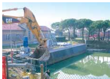
1a - Impianto Idrovora Campalto Lavori di potenziamento

marea, quando il livello della laguna supera quelle delle terre confinanti. In particolare la capacità delle idrovore di Tessera dopo l'intervento passerà dagli attuali 24 metri cubi al secondo a 36 metri cubi al secondo; di questo parleremo nel prossimo numero, mentre in questo proponiamo qua sotto alcuni particolari dell'intervento sull'idrovora di Campalto. Di seguito altri interventi non di minore importanza, come quello sugli abbinati lungo via Martiri, la posa della nuova fognatura in una zona residenziale di Favaro e la pulizia dei tombini.