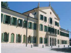
Il municipio di Favaro Veneto nel 2007

ritorio su cui si è nel tempo sviluppato l'abitato di Favaro. Dei corsi d'acqua che attraversavano queste terre, goltao, Fossa Destina, Bazzera rimane oggi solo quest'ultima, divenuta funzionale allo svolgimento dell'attività agricola. I terreni guadagnati divennero proprietà delle famiglie del patriziato veneziano e delle Istituzioni dello Stato, che fecero esercitare un'intensa attività agricola, in regime di mezzadria. Tali insediamenti maturarono e esercitarono nel tempo le pratiche, le abitudini, le ritualità tipiche della cultura rurale, che ancora oggi permangono vive e consapevoli. Il nucleo centrale dell'abitato si sviluppò all'incrocio dei principali assi viari del territorio, tra la strada comunale detta di Favaro (oggi via San Donà), la via detta spigariola (oggi via triestina), la strada dei gobbi (oggi via gobbi), la strada detta desariola (oggi via Altinia); qui si insediarono anche le princi-