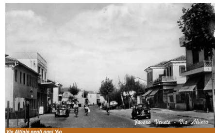
Via Altinia negli anni '60

pali funzioni civiche della comunità, nel momento in cui essa assunse funzioni amministrative e civili. In effetti, dal 1819 al 1866 Favaro Veneto fu deputazione comunale sotto la reggenza austriaca e, dal 1866 fino al 1926 Comune del neonato Regno d'Italia, chiamato ad amministrare le località di Campalto, Tessera, Dese e Ca' Noghera, oggi costituenti la Municipalità di Favaro Veneto. Le attività dell'Amministrazione pubblica, dapprima costrette ad una provvisoria precarietà, trovarono dimora nel palazzo municipale, edificato nel 1873 (e ampliato nel 1930), la cui facciata, di forma classicheggiante (evocante la tipologia della villa veneta di campagna), cinge lo spazio della centrale Piazza Pastrello. Il palazzo non ha abdicato alle ragioni che lo edificarono, ospitando ancor oggi le attività istituzionali e amministrative della Municipalità. Poco più a nord di