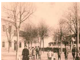
La piazza di Favaro Veneto agli inizi nel 1918, sulla destra è visibile il Municipio, con l'ala laterale priva del piano superiore

Ancora incerta è l'origine del nome di Favaro Veneto: per alcuni esso deriverebbe da faber, il fabbro che ferrava i cavalli alle mansiones, stazioni di sosta lungo le vie consolari romane; per altri farebbe riferimento alla presenza di numerosi fabbri residenti (nella vicina Altino esistendo un collegium fabrum, associazione che riuniva le persone che esercitavano tali professioni). Per secoli il territorio di Favaro Veneto dovette distinguersi per l'alternarsi tra terreni sopraelevati, popolati sovente da boschi, e avvallamenti paludosi, in un'epoca in cui il confine tra le lagune e le terre non era ancora stato ridotto sulla linea della conterminazione, bensì costituiva una superficie estesa, mutevole e cangiante. Le opere di progressiva sistemazione idraulica, avviate dai savi della Serenissima con la diversione dei corsi d'acqua e la realizzazione del taglio del Marzenego, e proseguite fino alle grandi bonifiche otto e novecentesche, permisero di sottrarre all'acqua molta parte del ter-