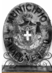
L'antica stemma del municipio di Favaro Veneto

ritorio su cui si è nel tempo sviluppato l'abitato di Favaro. Dei corsi d'acqua che attraversavano queste terre, goltao, Fossa Destina, Bazzera rimane oggi solo quest'ultima, divenuta funzionale allo svolgimento dell'attività agricola. I terreni guadagnati divennero proprietà delle famiglie del patriziato veneziano e delle Istituzioni dello Stato, che fecero esercitare un'intensa attività agricola, in regime di mezzadria. Tali insediamenti maturarono e esercitarono nel tempo le pratiche, le abitudini, le ritualità tipiche della cultura rurale, che ancora oggi permangono vive e consapevoli. Il nucleo centrale dell'abitato si sviluppò all'incrocio dei principali assi viari del territorio, tra la strada comunale detta di Favaro (oggi via San Donà), la via detta spigariola (oggi via triestina), la strada dei gobbi (oggi via gobbi), la strada detta desariola (oggi via Altinia); qui si insediarono anche le princi-