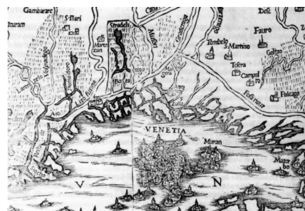
Mapa della fine del XVI secolo nella quale è indicato Favaro. (Museo Correr)