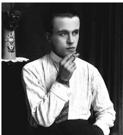
ATELIER ALBANIA Ritratto di un paese nelle immagini della Fototeca Marubi