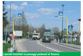
I portali installati ai passaggi pedonali di Tessera

letica in corrispondenza dei passaggi pedonali su via Orlanda. Sono stati installati alcuni pannelli "a portale", dotati di luci, che rendono molto visibile l'attraversamento e quindi garantiscono maggiore sicurezza ai pedoni. In via Gobbi sono stati completati i percorsi ciclopedonali su entrambi i lati della carreggiata. In particolare è stata ultimata la pista ciclabile monodirezionale dalla Residenza Anni Azzurri verso Campalto e sul lato destro in direzione di Campalto è stato sistemato ed asfaltato il marciapiedi da Favaro sino all'incrocio con via Mandricardo, con il riordino ed una migliore segnaletica degli spazi per il posizionamento dei contenitori per la raccolta dei rifiuti. Con l'occasione è stata sistemata anche l'aiuola spartitraffico situata all'incrocio fra via Gobbi e la bretella stradale in direzione della piscina.