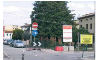
La sistemazione dell'incrocio fra via Gobbi e la bretella proveniente dalla piscina