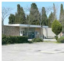
>> Il cimitero di Campalto sarà ampliato

Il primo chiede che una parte delle somme derivanti dall'aumento delle tariffe TIA (Tariffa Igiene Ambientale) sia destinata ad iniziative per la riduzione del volume complessivo dei rifiuti, al fine di spezzare il circolo vizioso dell'aumento dei rifiuti e con-