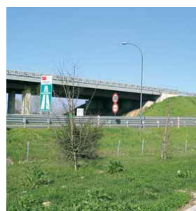
>> Presso la rotatoria di Dese sarà costruito il sottopasso ciclopedonale.