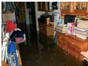
Immagini dell'alluvione del settembre 2006