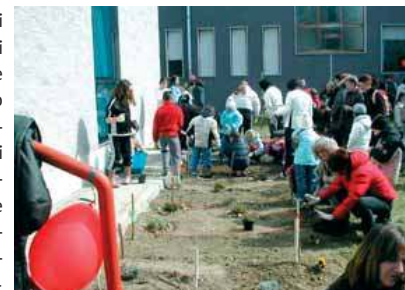
>> Marzo 2008 - L'iniziativa "Nontiscordardime" - Operazione scuola pulite, in collaborazione con Legambiente, ha coinvolto, per la terza volta, tutte le scuole dell'Istituto

Offerta Formativa), tra i quali quello di dare continuità tra i diversi ordini di scuole dell'Istituto, il progetto Intercultura, che mira all'accoglienza degli allievi stranieri (che sono circa il 10% del totale, e in costante aumento) e include l'attivazione di laboratori per l'apprendimento dell'italiano sin dalla scuola dell'infanzia, l'integrazione delle disabilità, l'orientamento verso i percorsi formativi successivi e le nuove tecnologie nella didattica. Ma le peculiarità dell'Istituto comprensivo 'Gramsci' non finiscono qui: "abbiamo un progetto europeo di partenariato multilaterale con scuole di altri cinque paesi, nel quale i nostri allievi giocheranno direttamente un ruolo attivo, come giornalisti e fotografi in erba. L'idea è quella di stimolare i ragazzi stessi, aiutati dai loro insegnanti e anche dagli esperti delle associazioni, a costruire e gestire un blog, una newsletter o entrambi, facendone strumenti di documentazione in italiano, inglese e francese riguardanti la storia e l'attualità del territorio e della comunità in cui vivono. Un concetto di continuità del percorso educativo e formativo coinvolge allievi, insegnanti e famiglie, per rendere più fluido il passaggio da un livello all'altro: dalla materna alla primaria, con il progetto "Danza" e l'insegnamento precoce della lingua inglese a partire dai 5 anni; dalla primaria alla secondaria con il progetto "Più Sport