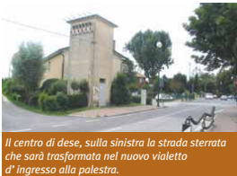
Il centro di Dese, sulla sinistra la strada sterrata che sarà trasformata nel nuovo vialetto d'ingresso alla palestra.

scuola. La nuova strada avrà una lunghezza di 170 metri e larghezza di 5 metri, più un marciapiede di 1 metro e mezzo e sarà dotata dell'impianto dell'illuminazione pubblica. Il progetto prevede l'asfaltatura della strada, la pavimentazione dei marciapiedi in betonelle di cemento colorato e la sistemazione dell'area a parcheggio in masselli di calcestruzzo alveolare, che consentiranno il drenaggio delle acque meteoriche. L'area destinata a parcheggio sarà recintata con rete metallica e accessibile attraverso un varco chiuso da un cancello scorrevole largo 6 metri.