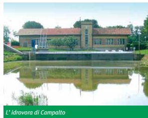
L'idrovoro di Campalto

Risponde a questo scopo l'impianto costruito da VESTA in via Monte Mesola, costituito da una grande vasca per la raccolta delle acque di prima pioggia e dalle pompe per il successivo "travasamento" nella Fossa Pagana, che a sua volta confluisce all'idrovoro di Campalto. Il "vascone" consente anche l'eventuale accumulo temporaneo in attesa del passaggio dell'onda di piena. VESTA ha avviato anche le procedure per appaltare la costruzione dei "pettini" per raccogliere le acque piovane nella zona a nord di via San Donà e convogliarle nel nuovo collettore di via Marmolada.