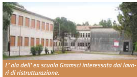
L'ala dell'ex scuola Gramsci interessata dai lavori di ristrutturazione.

Con una spesa di 400 mila euro, saranno completate le opere di manutenzione straordinaria decise dal Comune e dalla Municipalità allo scopo di recuperare ad uso pubblico l'edificio di Villaggio Laguna che ha cessato la funzione scolastica ormai da molti anni. Un edificio che, seppure bisognoso di restauro, conserva un notevole valore per la collettività, essendo situato al centro di una zona densamente abitata, ma in un contesto grade-