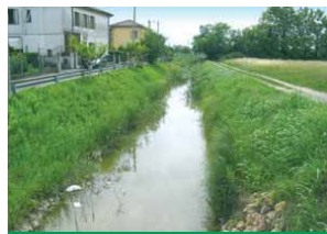
La Fossa Pagana

I lavori saranno eseguiti tra la fine del 2007 e l'inizio del 2008. Il Consorzio Dese Sile, ha invece avviato alcuni interventi che interessano la Fossa Pagana. Nei pressi di via Don Domenico Savio sarà raddoppiata la portata di una botte-sifone, mentre a Campalto è prevista l'eliminazione di una strozzatura che rallenta il deflusso delle acque verso l'idrovoro e un intervento di ricalibratura dell'alveo del corso d'acqua, con la creazione di alcune aree golenali, che in caso di piena potranno allargarsi e fare da bacino di contenimento temporaneo delle acque. Il Consorzio di bonifica Dese Sile prevede l'esecuzione degli interventi entro il 2008.