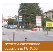
Barriere architettoniche abbattute in Via Gobbi

vede per il triennio 2006/2008 una spesa di 120 mila euro l'anno. I lavori sono progettati e realizzati a cura dell'ufficio gestione del territorio della Municipalità, che spesso programma gli interventi anche sulla base delle richieste o segnalazioni di