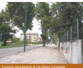
Il nuovo marciapiedi di via Passo Campalto

Nel frattempo proseguono a ritmo serrato anche i lavori di rifacimento dei marciapiedi e dell'arredo urbano nel tratto di via Passo Campalto compreso tra via dei Gradenighi e la darsena. Un intervento atteso da tempo dai cittadini, che presto potranno usufruire di un percorso sicuro per gli spostamenti tra il centro di Campalto e la gronda lagunare oppure il Villaggio Laguna. Nel tratto compreso tra il supermercato e il ponte, sul lato sinistro in direzione del Passo, i lavori sono già stati ultimati, mentre sono in corso quelli sul lato opposto della strada. Subito dopo sarà costruita anche la passerella ciclopedonale sul lato del ponte che attualmente ne è sprovvista.