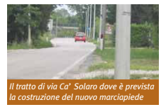
Il tratto di via Ca' Solaro dove è prevista la costruzione del nuovo marciapiede.

Sistemazione dei marciapiedi di via Altinia e via Ca' Solaro - Il progetto prevede due interventi distinti di manutenzione e realizzazione di marciapiedi in via Altinia e in via Ca' Solaro, per una spesa complessiva di 250 mila euro. In via Altinia sarà eseguita la sistemazione e manutenzione del tratto di marciapiedi esistente sul lato sinistro in direzione di Dese, compreso tra la farmacia Comunale e il capolinea ACTV. I nuovi marciapiedi saranno realizzati in betonelle di