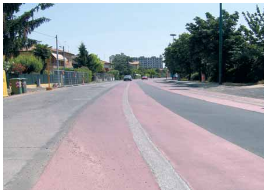
>> La “piattaforma tramviaria” in via Triestina, nella zona antistante il centro

Man mano che le piattaforme vengono ultimate viene ripristinata la continuità della superficie stradale con il riempimento delle zone scavate in precedenza e la conseguente ripresa del manto di asfalto. Questo primo intervento di riempimento non deve considerarsi definitivo perché, a causa dell’inevitabile assestamento del terreno al passaggio dei mezzi pesanti, dopo qualche tempo possono formarsi delle discontinuità. È previsto quindi un successivo intervento di asfaltatura “a finire” dopo che la costipazione del terreno sarà arrivata a stabilizzarsi. L’ultimo intervento per ripristinare la situazione sarà la ricostruzione dei marciapiedi: ma in questo caso si parla di piccoli cantieri non invasivi per la normale circolazione dei veicoli. «In questi mesi si è creato un clima di fattiva collaborazione tra la Municipalità e PMV, la società di pro-