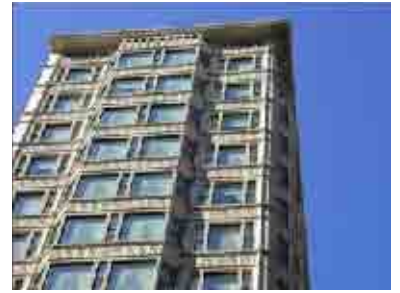
Daniel Burnham & Charles Atwood Reliance Building, Chicago

Perhaps the best-known tour is the Architectural River Cruise, which we developed nearly 15 years ago. Our two boats in 2004 carried 125,000 people. This summer we will be adding a third boat. In addition we do architecture trips outside of Chicago. These have included Seattle, New York,