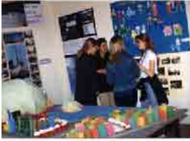
Maggio 1998, incontro mostra "Maggio della Città": presentazione dei lavori d'indagine e proposta sulla città fatti da studenti delle scuole in collaborazione con la Casa della Città