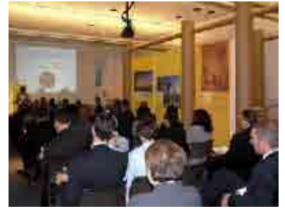
The John Buck Company Lecture Hall Gallery

As the movement of architecture centers and urban centers is gaining momentum throughout the world, CAF is also increasingly recognized as a leader and a model. In response, we are currently developing a strategy for the formation of the "Association of Architecture Organizations" - a working title. The Association, which will embrace urban centers, will assist the many groups that