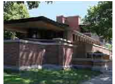
Frank Lloyd Wright Robie House, Chicago