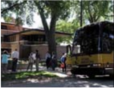
CAF Highlights by Bus Tour