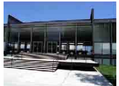
Mies van der Rohe Crown Hall, IIT Campus, Chicago