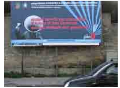
Gennaio 2006, open space technology a San Giovanni a Teduccio (Napoli): l'incontro conclusivo delle attività di consultazione locale su un "programma innovativo in ambito urbano", progettate da Avventura Urbana e realizzate con la Casa della Città

Quando vi è uno scarto troppo forte fra l'immagine della città così come noi la presentiamo e quella percepita dai suoi abitanti, la comunicazione è destinata a fallire. Mentre, la sua onesta chiarezza può aiutare quel rapporto di fiducia reciproca fra istituzioni e cittadini, che sarebbe bello fosse costitutivo delle nostre città. Ma che in questo ci si riesca è un altro discorso.