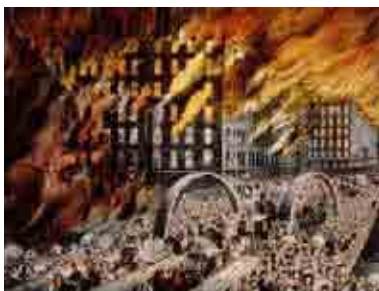
The great fire of 1871