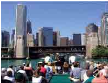
CAF Architecture River Cruise