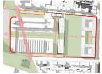
Area Lancia - Ipotesi di schema morfologico 1

In un contesto ricco, come abbiamo detto, di esperienze di comunicazione delle trasformazioni più o meno riuscite, UCM sta costruendo una propria strategia comunicativa che sia capace di affiancare da un lato i linguaggi esistenti, destinati al grande pubblico, e allo stesso tempo di scommettere su linguaggi nuovi, più complessi e con diversi livelli di discorso. Su queste ipotesi si basano le idee guida elaborate per il riallestimento di Atrium come padiglione espositivo di Urban Center Metropolitano, che dovrebbe realizzarsi tra la fine del 2006 e l'inizio del 2007.