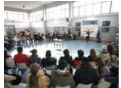
Gennaio 2006, open space technology a San Giovanni a Teduccio (Napoli): l'incontro conclusivo delle attività di consultazione locale su un "programma innovativo in ambito urbano", progettate da Avventura Urbana e realizzate con la Casa della Città