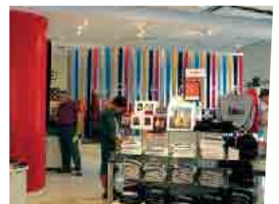
Shop & Tour Center