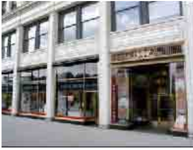
Chicago Architecture Foundation Shop & Tour Center "ArchiCenter"