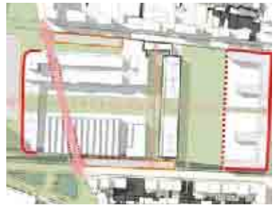
Area Lancia - Ipotesi di schema morfologico 2