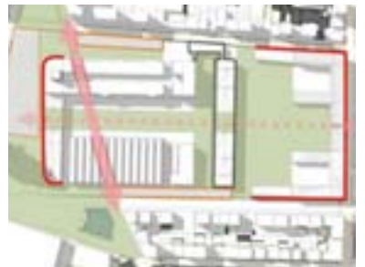
Area Lancia - Ipotesi di schema morfologico 5