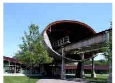
Rem Koolhaas Campus center - IIT, Chicago