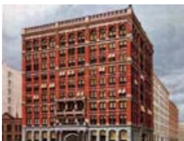
William Le Baron Jenney Home Insurance Building, Chicago