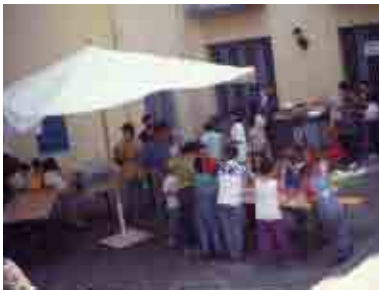
Giugno 1999, manifestazione "La campagna in città": incontro conclusivo (convegno, mostra-mercato e concerto) sulla promozione dell'agricoltura urbana, curato da Casa della Città con l'Associazione Fondi Rustici