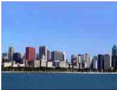
The skyline of Chicago

William LaBarron Jenney designed the first skyscraper - the Home Insurance Building here. We have such luminaries of the First Chicago School as Louis Sullivan, and his wonderful Auditorium