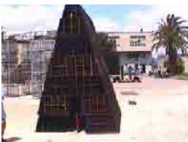
Maggio 2000, rassegna "Altro che ghisal": mostra conclusiva del laboratorio di "riciclarTE" nella centrale Enel curata dall'Associazione ArteFatto in collaborazione con la Casa della Città

proposito, vale la pena richiamare l'attenzione su un'esperienza che a Napoli ha legato in un nesso inedito e fertile scuola e città. E' l'esperienza ideata e promossa, nel '92, dalla fondazione Napoli 99 in collaborazione con le scuole e, poi, dal '95, assunta dal Comune. Il meccanismo è semplice: ogni scuola adotta un monumento dedicando a esso lavori di ricerca, poi lo mostra alla cittadinanza in visite guidate nelle domeniche di maggio. Ne è risultata una partecipazione popolare imprevedibilmente ampia, facendo delle scuole il luogo dove ha più radici la passione per la conoscenza e la cura della città e della sua storia.