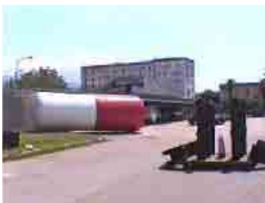
Maggio 2000, rassegna "Altro che ghisal": mostra conclusiva del laboratorio di "riciclarTE" nella centrale Enel curata dall'Associazione ArteFatto in collaborazione con la Casa della Città