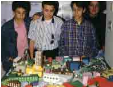
Maggio 1998, incontro mostra "Maggio della Città": presentazione dei lavori d'indagine e proposta sulla città fatti da studenti delle scuole in collaborazione con la Casa della Città