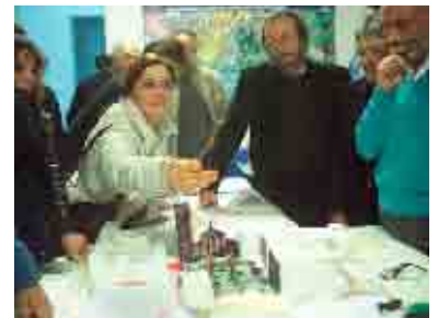
Marzo 2006, Laboratorio Piau San Giovanni a Teduccio: incontro di progettazione partecipata con abitanti e operatori locali, progettato da Avventura Urbana e realizzato con la Casa della Città