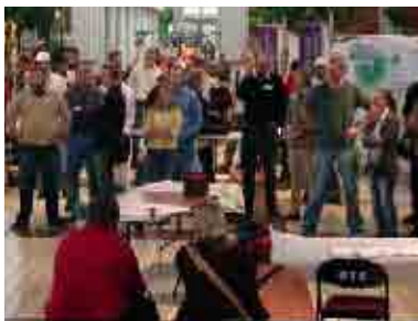
Public dialogue about the built environment