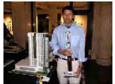
Newhouse Program and Architecture Competition