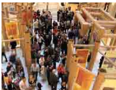
Big & Green Exhibition in the atrium