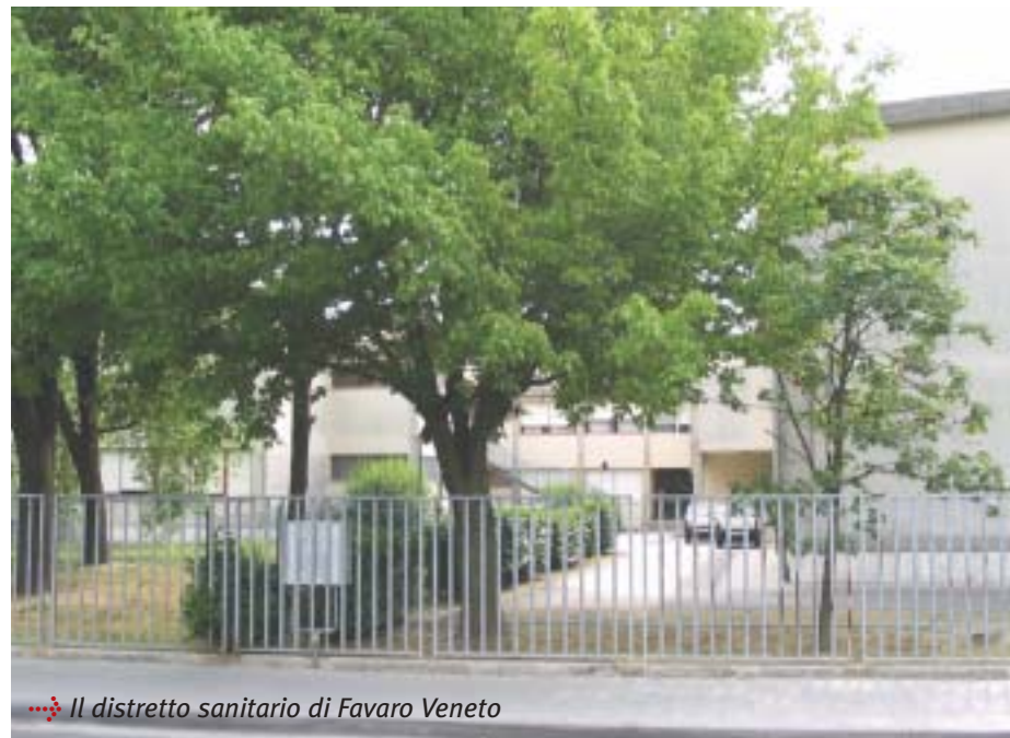
Il distretto sanitario di Favaro Veneto

cludere in tempi rapidi la discussione ed il confronto con tutti i soggetti interessati, per raccogliere eventuali proposte, per poi passare all'approvazione definitiva, anche da parte delle altre Municipalità e comuni,