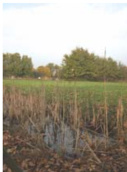
Uno scorcio del bosco di Mestre