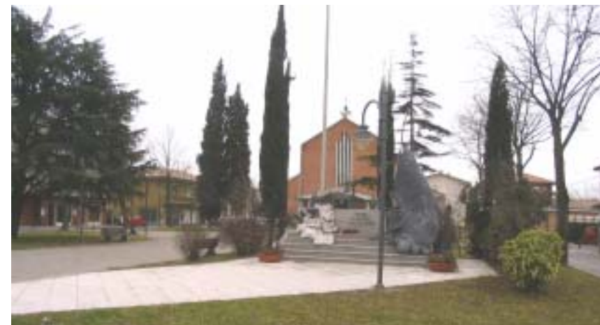
La piazza di Tessera

Ogni anno il cittadino sarà informato su quello che è stato fatto e quello che si farà nell'anno successivo ed è su questi due elementi che saremo giudicati.