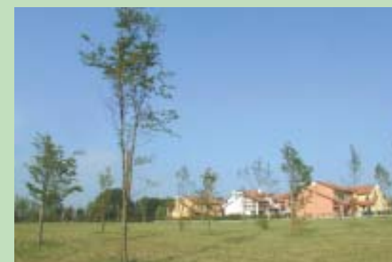
Il parco realizzato nell'ex area Ca' Dolfin

Nel parco Monviso, ad esempio, è prevista la sistemazione delle fontanelle, delle panchine e di alcuni giochi per bambini: le due torri con palestra, l'altalena e la palestrina. In via Monte Celo, invece, sarà sistemata la torretta con lo scivolo, in piazzale Zandrini ci sono da