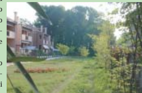
Il boschetto creato su un'area abbandonata di via Passo Campalto

Successivamente sarà realizzato un vialetto che, partendo da quello già esistente, proseguirà lungo tutta la parte destinata a prato.