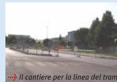
Il cantiere per la linea del tram

“Il tram è una soluzione avveniristica ai problemi del trasporto pubblico nella terraferma veneziana e contribuirà a ridurre il traffico e l'inquinamento.