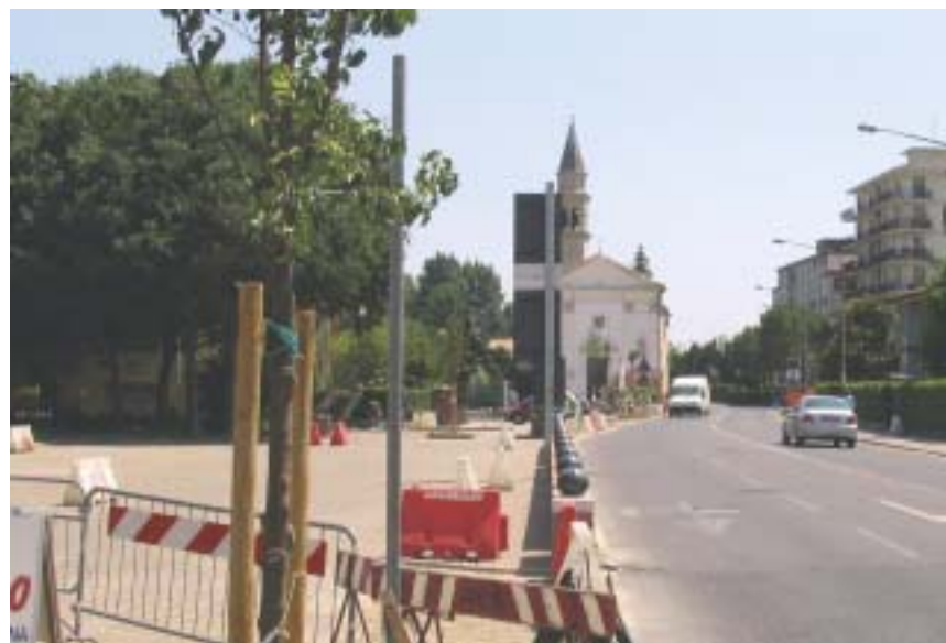
I lavori di riqualificazione del centro di Campalto