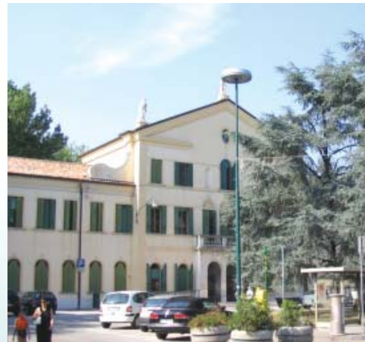
Piazza Pastrello e il palazzo Municipale