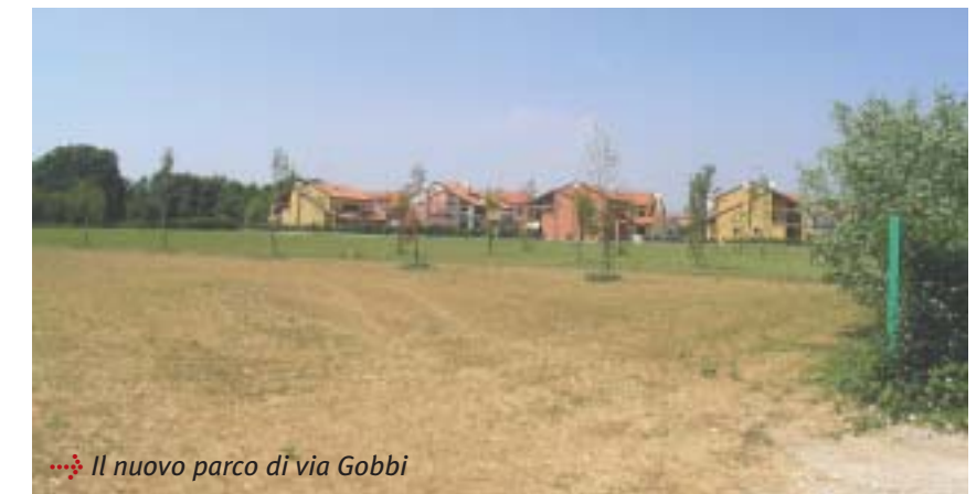
Il nuovo parco di via Gobbi

spazi di verde pubblico esistenti e prevedere un ulteriore incremento delle aree e strutture al servizio della popolazione.