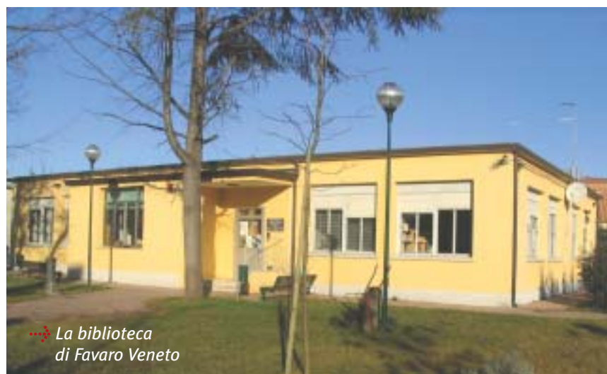
→ La biblioteca di Favaro Veneto

re il maggior numero di appuntamenti, tra i quali vi sono il Mercatino della solidarietà, la Festa di San Martino, le iniziative del periodo natalizio e di fine anno. In occasione del sessantesimo anniversario della Liberazione, la Municipalità ha avviato un pro-