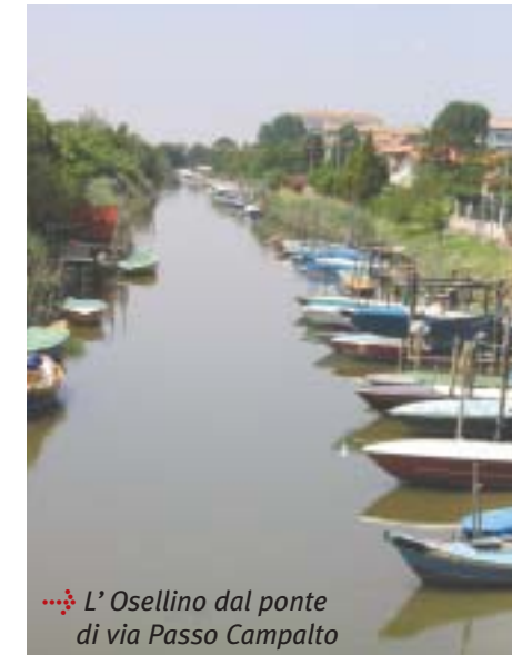
L'Osellino dal ponte di via Passo Campalto

teristiche di grande interesse ambientale e paesaggistico. Oltre il 70 per cento del bosco di Mestre si trova sul territorio di Favaro Veneto, proprio perché in questa zona ci sono ancora grandi spazi liberi, sui quali realizzare questo grande