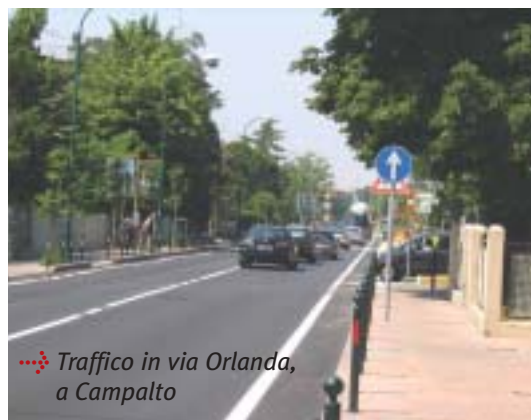
Traffico in via Orlanda, a Campalto

debba interagire con le altre municipalità, il Comune, la Provincia e l'ACTV, per elaborare un progetto coordinato riguardante mobilità, viabilità e trasporto pubblico, nell'ambi-