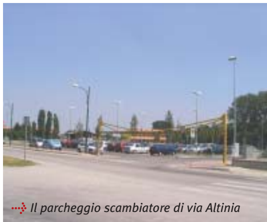
Il parcheggio scambiatore di via Altinia