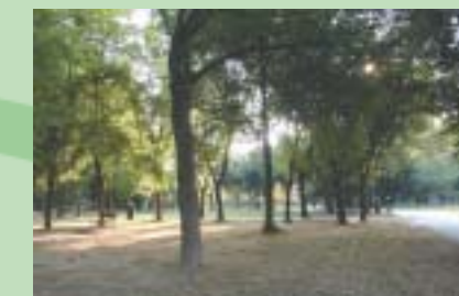
L'area verde di piazzale Zandrini

aggiustare oltre alla torretta, anche l'altalena e le staccionate dell'area con i gazebo. Nello spazio verde del Villaggio Laguna l'intervento riguarderà l'altalena e la torretta con lo scivolo, così come in via Morosina e in via Bagaron, dove ci sono però da sistemare anche i giochi a molla a forma di pesce e cavallo.