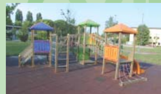
L'area verde della ex scuola Fucini

In programma ci sono altri lavori di recupero e riqualificazione ha riguardato una zona abbandonata in via Passo Campalto; il secondo, invece, la creazione di un nuovo parco all'interno di una spazio di nuova edificazione, la cosiddetta ex area Ca' Dolfin.