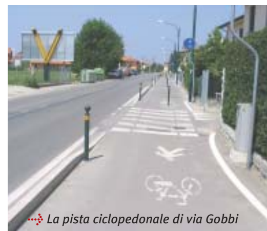
La pista ciclopedonale di via Gobbi

Nei prossimi mesi la municipalità seguirà molto attentamente l'attuazione del PUT, il piano Urbano del Traffico, approvato recentemente, nel