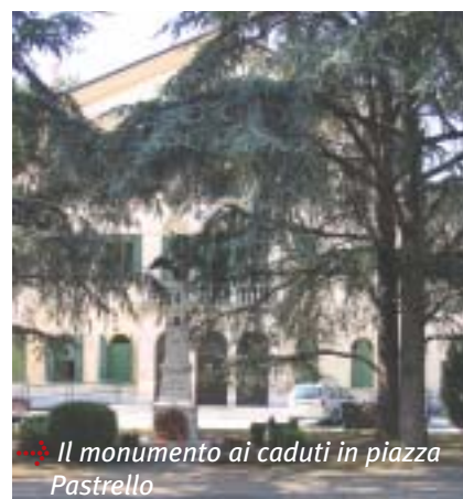
Il monumento ai caduti in piazza Pastrello

potrà essere chiusa per aumentare lo spazio della piazza. Con gli stessi materiali impiegati per la piazza, sarà pavimentato anche il tratto di via San Maurizio fino alla chiesa, davanti alla quale è prevista la composizione di un disegno per evidenziare il luogo sacro. Nelle aree pedonali saranno installate panchine, cestini portarifiuti e un impianto di illuminazione costituito da lampioni e lampade incassate sul pavimento antistante la facciata del Municipio.