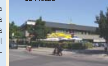
Il centro commerciale "La Piazza"

comprende la fiesta di Halloween , con il concorso per l'allestimento delle vetrine e la festa degli alunni; l' esposizione ornitologica e rassegna cinofila inserita nell'ambito delle manifestazioni cam-